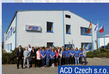
ACD Czech s.r.o.

Elektronische Produktions-dienstleistungen (EMS)