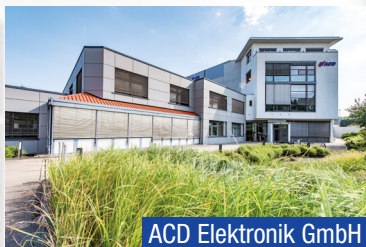
ACD Elektronik GmbH

Entwicklung mobiler Geräte und Anwendungen in der Industrie-elektronik und deren Produktion