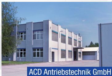
ACD Antriebstechnik GmbH

Entwicklung mobiler Geräte und Anwendungen in der Industrie-elektronik und deren Produktion