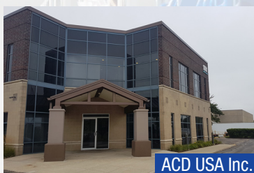
ACD USA Inc.

Elektronische Produktions-dienstleistungen (EMS)