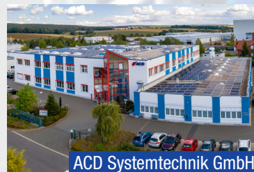
ACD Systemtechnik GmbH

Entwicklung anforderungs-optimierter Antriebselektronik