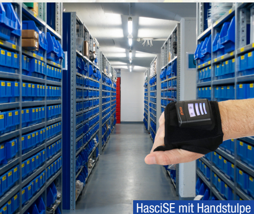
HasciSE mit Handstulpe